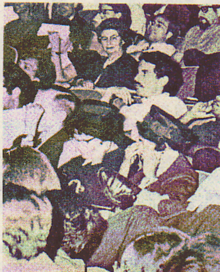
(reacció del públic durant una projecció de The Flicker )

John Cage, La Monte Young i el grup alemany Faust. Amb John Cale, Angus MacLise, Walter de Maria i Lou Reed, forma part de The Primitives, l'embrió d'on va sorgir The Velvet Underground. És el compositor de la banda sonora del film de Jack Smith Flaming Creatures (1963). Des del 1966 ha realitzat nombrosos films, objectes fílmics, performances i instal·lacions cinematogràfiques i vídeos. Recentment ha editat un nou disc, Slapping Pythagoras , i també s'ha reeditat en CD la seva llegendaria col·laboració amb Faust, Outside The Dream Syndicate (1972).